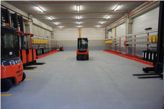
PORTE D'ENTREE SdCh N°1