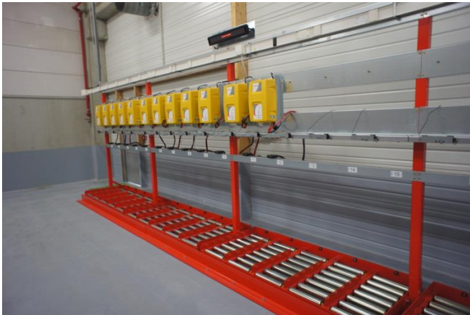
Tables batteries 24v