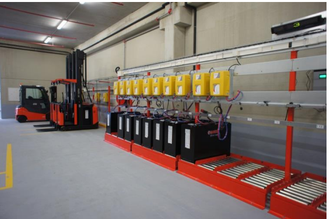
Tables à rouleaux 48v