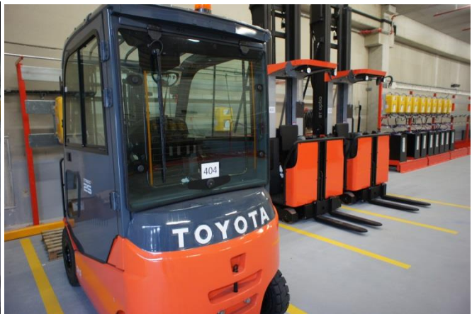
Côté batteries 48v