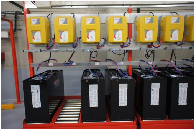
Installation chargeurs et câblage