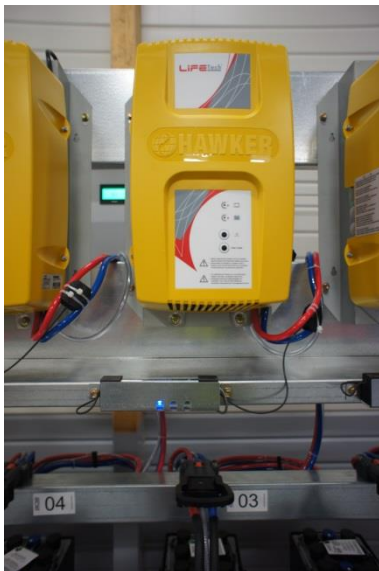
Chargeur prise fixe et sentilles