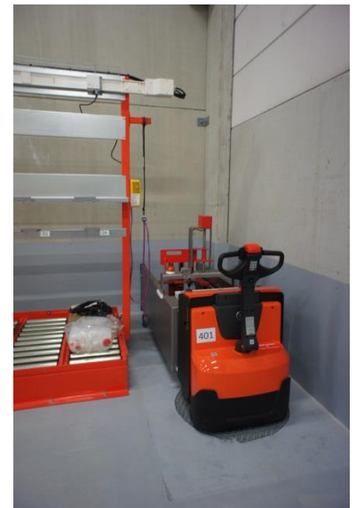
Tireur Pousseur MICA TPX-V

https://www.youtube.com/watch?v=ECg9frf91rM&feature=youtu.be Cliquez sur le lien pour video MICA TPXV