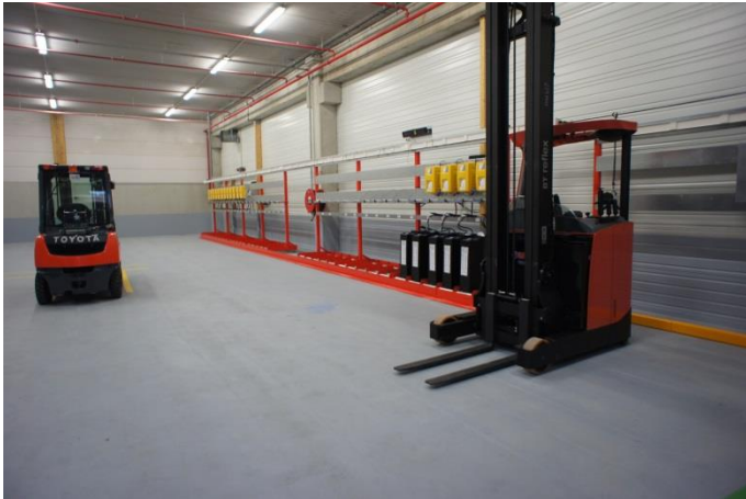
Côté batteries 24v