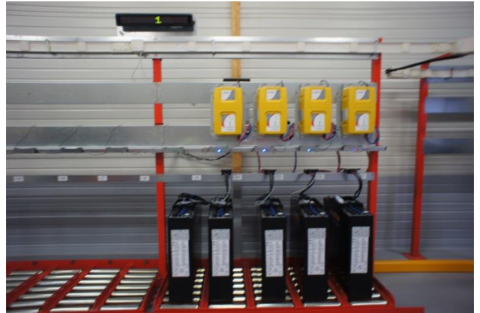
Tables à rouleaux 24v