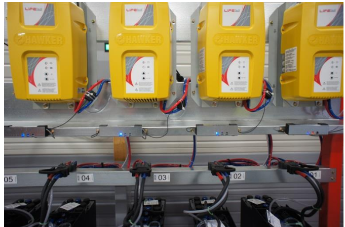
Système gestion par Numéro dechargeur disponible