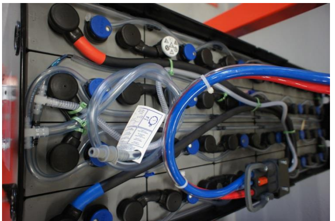
Batteries à Brassage d'air