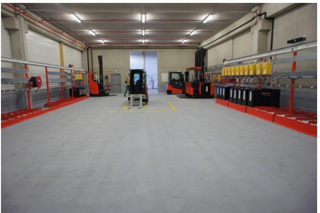
Salle de Charge vue du fond